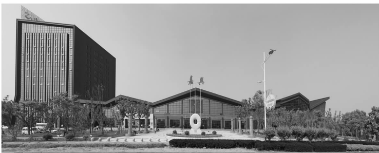
浙江省嘉兴汽车客运中心（浙江省建工建筑设计院设计） 浙江省“钱江杯”优秀勘察设计一等奖