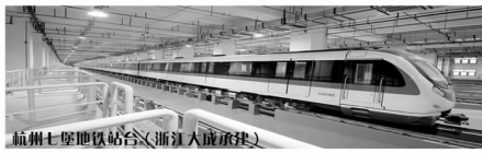
杭州七堡地铁站合(浙江大成承建)