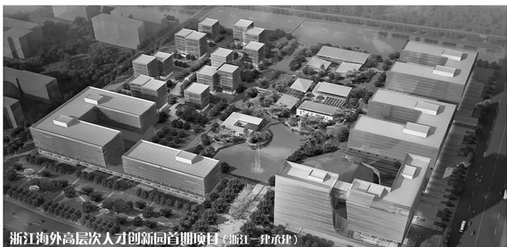
浙江海外高层次人才创新园首期项目（浙江一建承建）