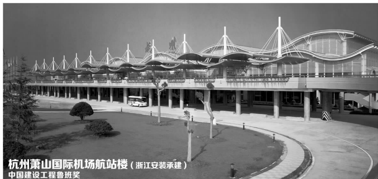
杭州萧山国际机场航站楼 (浙江安装承建) 中国建设工程鲁班奖