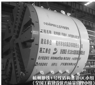
杭州地铁1号线盾构掘进QC小组 (全国工程建设优秀质量管理小组)